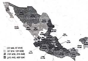
Mapa 2 POBLACION DE 15 AÑOS Y MÁS LGBTI+ POR ENTIDAD FEDERATIVA (Absoluta) 5 MILLONES DE PERSONAS DE 15 AÑOS Y MÁS LGBTI+